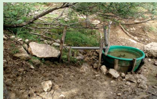
Les équipements structurent la circulation du troupeau

> Les bergers créent une compétition sur le pâturage entre les individus et orientent leur impact sur les végétations, lorsqu'ils gardent les animaux d'une manière plus ou moins serrée.