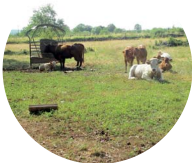
La distribution de foin peut démotiver les animaux au pâturage

>> Ce qu'on apporte ne doit pas être concurrent avec ce qu'on va chercher dehors , mais au contraire stimulant (mise en appétit). Cela doit servir à améliorer les capacités digestives (flore du rumen, pas d'encombrement).