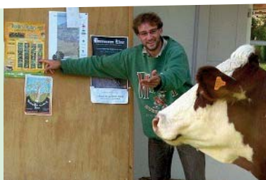
Le comportement alimentaire des ruminants s'apprend