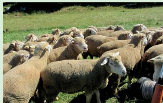
Situation d'attente devant la poste d'entrée, à l'heure habituelle de la distribution de compléments.

> Lorsqu'ils sont lestés au départ, les ruminants exacerbent au pâturage leur comportement sélectif en recherchant les portions les plus jeunes des plantes. Cette attitude du troupeau conforte l'éleveur dans l'idée que ses pâturages ne valent pas grand-chose. Il rajoute du foin et il perd progressivement confiance vis-à-vis de l'extérieur.