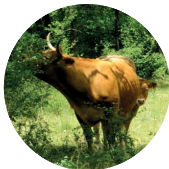
Les adultes forment les jeunes