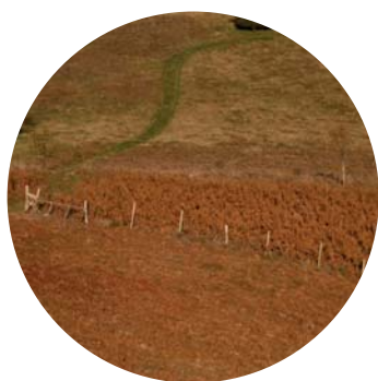
un refend avec des parcs électrifiés

> Les animaux expriment moins leurs préférences alimentaires du fait de la "compétition/stimulation" entre individus si on augmente le nombre d'animaux sur un secteur réduit. On peut faire consommer ainsi des ressources peu appétentes telles des graminées grossières.