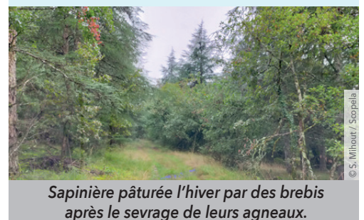
Sapinière pâturée l'hiver par des brebis après le sevrage de leurs agneaux.