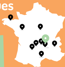
localisation des journées précédentes

Elles sont organisées auprès de 3 jeunes éleveurs en bovins lait et brebis viande. Nous aborderons les décisions techniques et socio-économiques à prendre lors de l'installation. Décisions qui sont en continuité ou en rupture avec le système en place (investissements, pratiques d'alimentation, conduite des surfaces...). Nous discuterons aussi de la notion d'autonomie.