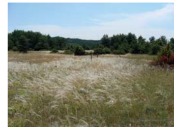
Un mode d'exploitation estival, qui laisse aux graminées plus lentes le temps de mettre en réserve et de rentrer en reproduction : une parcelle lente à démarrer mais avec un bon report sur pied estival.