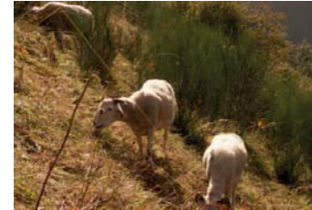
La présence de buissons est favorable au report sur pied.

--> La consommation de fourrages fibreux nécessite des phases de repos et de rumination (temps de vidange du rumen). Ceci influe directement sur l'appétit.