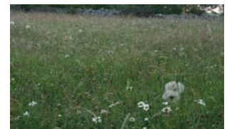
Les milieux diversifiés ont un bon report sur pied.

--> Le « pailleux » protège les repousses ou semis, tard en saison (sécheresse, vent, neige...).