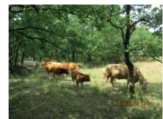
Ressources complémentaires bois frais/prairie mûre.

--> Construire des parcs qui intègrent des végétations diversifiées et des zones de repos fonctionnels (accueil de l'ensemble du troupeau). Respecter le rythme d'activité des animaux et allonger le temps de pâturage. Par exemple mettre les animaux au pâturage la nuit en été, car ils se reposent pendant les heures chaudes.