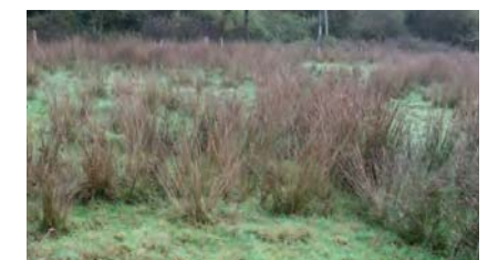
Bien conduit, le pâturage peut construire une mosaïque de graminées et de joncs

Ce petit changement dans l'objectif permet d'envisager plus sereinement les pratiques à mettre en oeuvre sur les parcelles. L'itinéraire technique est plus souple , il s'agit de consommer de façon complète les zones dominées par les graminées dans chaque parcelle. Ce pâturage limite l'extension du jonc, en favorisant des touffes bien délimitées.