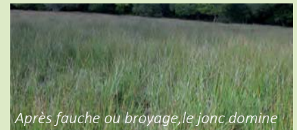
Après fauche ou broyage, le jonc domine

Mais la mise en oeuvre de cette conduite était difficilement envisageable, à la fois :